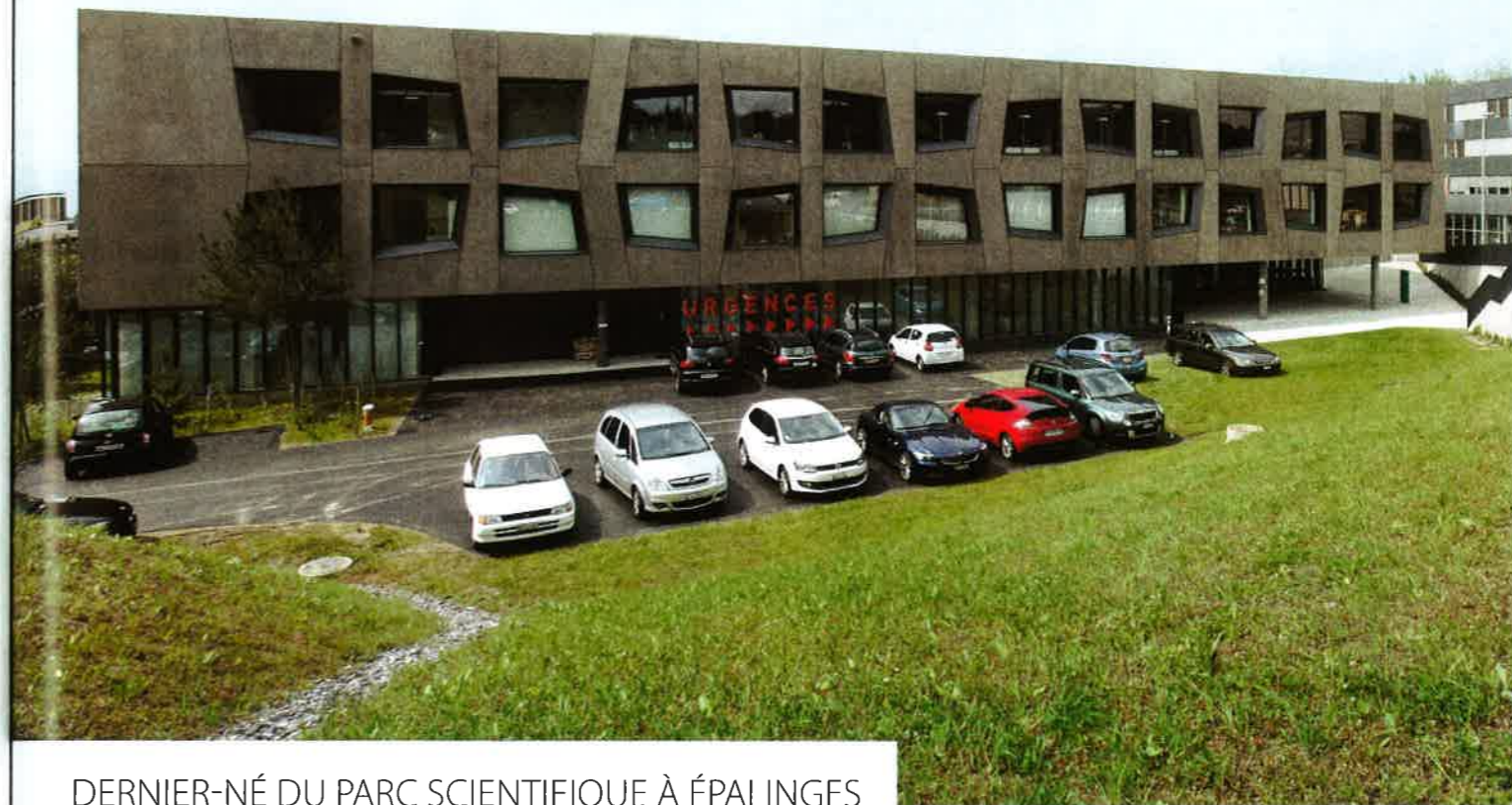
DERNIER-NÉ DU PARC SCIENTIFIQUE À ÉPALINGES