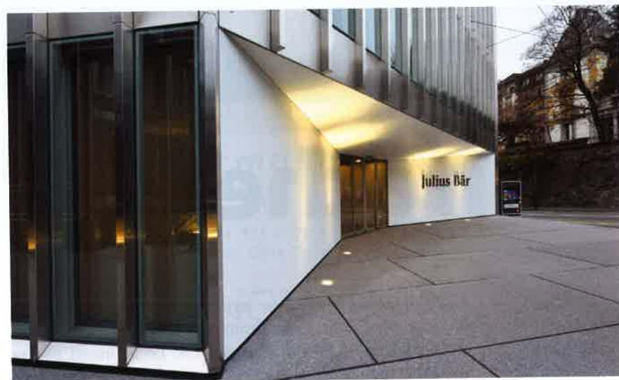
Le bâtiment, en forme de «C», s'inscrit dans une double déclivité au croisement de l'avenue de la Gare et de l'avenue d'Ouchy.