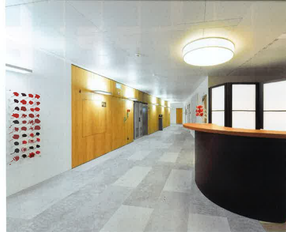
Entrée, espace bureau et de réception et, en bas, les circulations dans l'attique.

qui constituent sa façade en font un bâtiment très vivant, alors qu'il n'a qu'une trame similaire d'un bout à l'autre.»